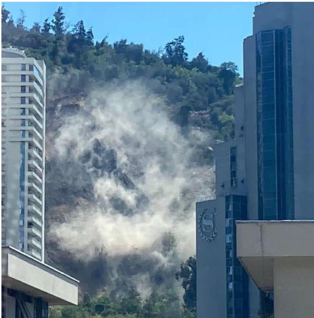
► El sismo de ayer martes produjo un deslizamiento de tierra en el Cerro San Cristóbal.

Título: Fuerte temblor remece la Región Metropolitana y gran parte de la zona central