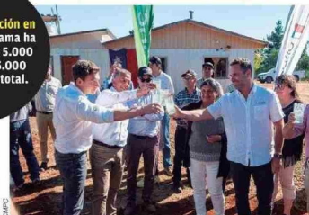
Inauguración del nuevo APR, el 13 de enero recién pasado.

Desde su creación en 2019, el programa ha beneficiado a 5.000 familias y 15.000 personas en total.