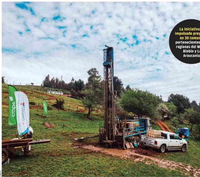
Construcción del sistema APR en Collipulli.