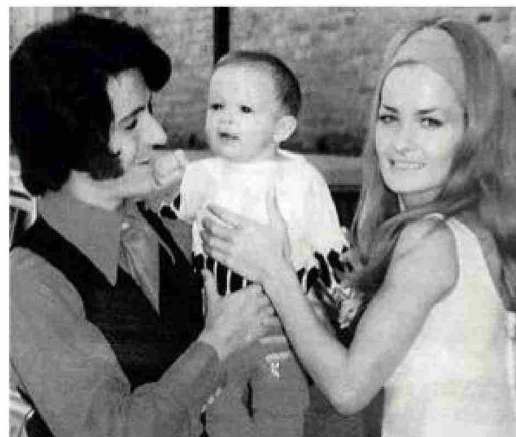
Luisito Rey y Marcela Basteri tuvieron una atormentada relación.