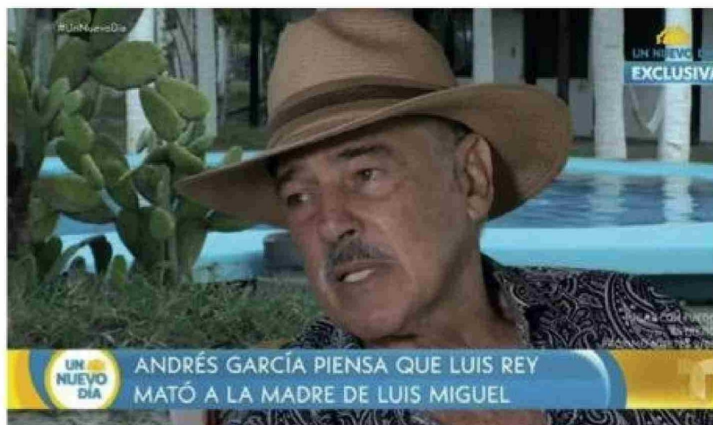
El actor Andrés García apoyó a Luis Miguel al inicio de su carrera.

Título: Qué pasó con la madre de Luis Miguel: agentes secretos, la pista argentina y una verdad que Luisito Rey se llevó a la tumba