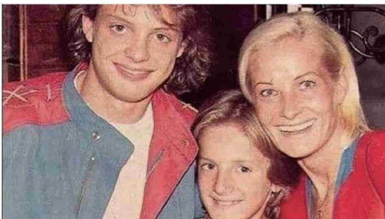
Marcela Basteri junto a sus hijos Luis Miguel y Alex.