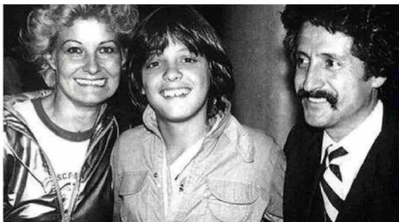
Luis Miguel y sus padres, en tiempos felices.