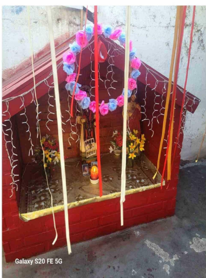
Galaxy S20 FE 5G

protagonists of the creative process, promoting the exploration, the experimental material and the reflection on the heritage and its vigency in the daily life.