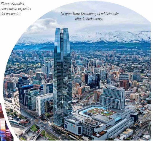
La gran Torre Costanera, el edificio más alto de Sudamérica.