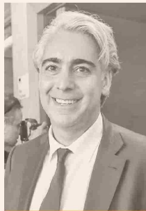
MARCO ENRÍQUEZ-OMINAMI, PARTIDO PROGRESISTA.