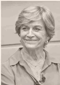
EVELYN MATTHEI, RN, UDI Y EVÓPOLI.