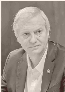
JOSÉ ANTONIO KAST, PARTIDO REPUBLICANO.

Título: Conflicto arancelario se toma el debate de los comandos presidenciales y obliga a revisar programas ante la incertidumbre global