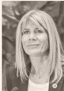
XIMENA RINCÓN, PARTIDO DEMÓCRATAS.