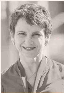
CAROLINA TOHÁ, PARTIDO POR LA DEMOCRACIA.