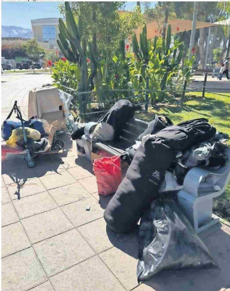
EN EL PARQUE SCHNEIDER ES COMÚN VER PERSONAS CON RUCOS.

La autoridad explicó que el Programa Noche Digna, busca brindar alternativas de hospedaje y atención básica a personas en situación de calle durante épocas de bajas temperaturas, a través de sus dispositivos: Albergue Protege; Albergue Público; Ruta Albergue; Ruta Médica y Residencia Familiar.