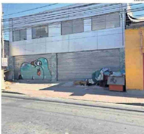
EN CALLE YERBAS BUENAS PERNOCTAN Y HAY CASAS PARA PERROS.

gen diariamente a las distintas personas que se encuentran en esta situación.