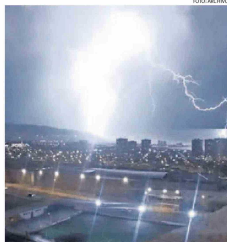
LAS DIFERENCIAS DE LAS CONDICIONES CLIMÁTICAS EN VERANO.

Por otro lado, SENAPRED actualizó la Alerta Temprana Preventiva para la Provincia de El Loa y las comunas de Antofagasta, Sierra Gorda, Taltal y María Elena, debido a un evento meteorológico que