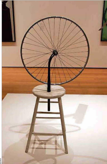
Duchamp: Rueda de bicicleta (1914), primer ready-made que hizo para crear una "escultura" desafiando la definición tradicional de arte.

En tanto, Zurbarán con su uso magistral del claroscuro en naturalezas muertas y en pintura sacra, integrará otra retrospectiva en la National Gallery de Londres, en mayo. La presentan como la primera gran monografía del pintor español en el Reino Unido. Llegan más de 50 obras de museos como El Prado, el Louvre y el Art Institute of Chicago, de una nueva era del realismo y que con su estilo ha llegado también a convertir algunos de sus cuadros en imágenes icónicas para diversos artistas como su pintura "El matrimonio Arnolfini".