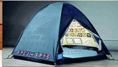
"La carpa" de Tracey Emin. Ahora en Tate Modern mostrarán además su nueva faceta más sensible y dolorosa.