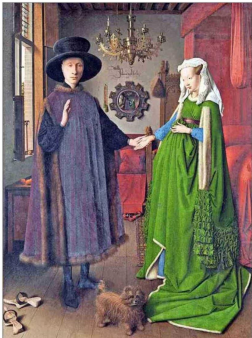
Van Eyck: "Matrimonio Arnolfini", 1434. Se le atribuye la invención de la técnica al óleo.

Todavía en invierno y tal vez con nieve, como en estos días, el Metropolitan Museum de Nueva York abre en marzo una completa retrospectiva con más de 200 obras del maestro renacentista, Rafael Sanzio, entre pinturas, dibujos y tapices provenientes de varios museos del mundo. La exposición tendrá dos características especiales: será solo montada para el Met a pesar de su envergadura, y su curadora está a cargo de una experta chilena, la curadora del departamento de dibujos y grabados del museo, Carmen Bambach, la misma autora de una de las mayores investigaciones sobre Leonardo da Vinci y curadora de la muestra sobre Miguel Ángel en 2017. Siete años le tomó preparar ahora esta megapostición. El director del museo afirma que ofrecerá "una mirada innovadora a la brillantez y legado de Rafael". El público podrá experimentar la variedad de su genio renacentista con su perfección estética a través de pinturas que raramente se prestan, con secciones temáticas y diferentes tipos de imágenes, como su representación de las mujeres, entre las que estará "Retrato de una dama con unicornio", también "Retrato de Baldassare Castiglione" o la hermosa "La virgen y el niño con san Juan Bautista", entre muchas que develan su extraordinaria capacidad de sintetizar los ideales clásicos y humanistas, con una belleza y profunda emoción humana.