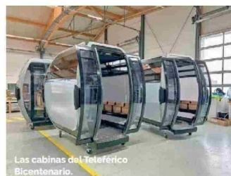
Las cabinas del Teleférico Bicentenario.