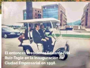
El entonces Presidente Eduardo Frei Ruiz-Tagle en la inauguración de Ciudad Empresarial en 1998.