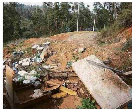
BASURA HA COLAPSADO EL CAMINO A LA LAGUNA.

En esta ecuación, La Estrella de Valparaíso también se comunicó con el administrador del restaurante emplazado en el sector.