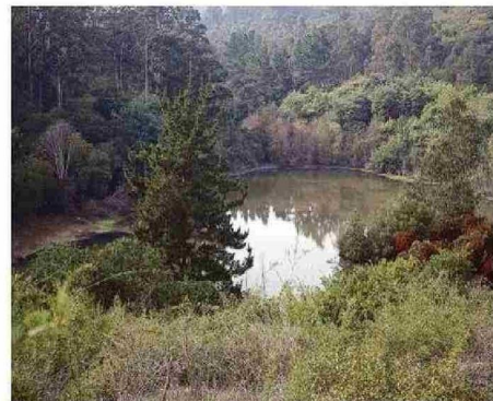
LAGUNA PERSISTE. FUNCIONA COMO UN EMBALSE.