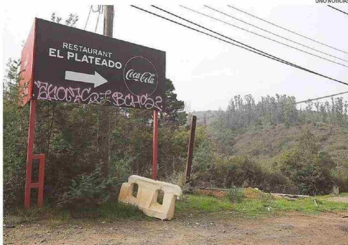
CARTEL RAYADO HACE PRESUMIR QUE EL LOCAL NO FUNCIONA, SIN EMBARGO, SIGUE ACTIVO.

"Efectivamente el sector al que se hace referencia se ubica dentro del Fundo Quebrada Verde, que don Federico Santa María donó en 1915 a la Junta de Beneficencia de Valparaíso y que posteriormente pasó a ser propiedad del Fondo Nacional de Salud", contextualizó Da-