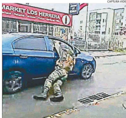
EL FUNCIONARIO POLICIAL QUEDÓ ATRAPADO CON LA PUERTA DEL COPILOTO DEL AUTOMÓVIL MARCA CHEVROLET, COLOR AZUL.

detenida. Es un joven de 24 años de edad. En este momento ya está a disposición del Ministerio Público, quienes finalmente resolverán la acción procesal que se va a adoptar contra esta persona”, precisó el oficial.