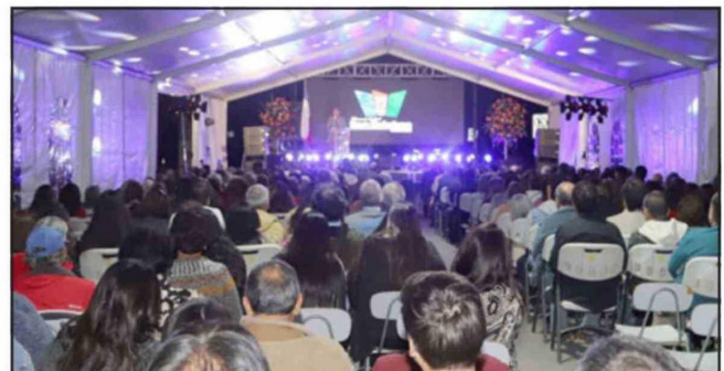
La ceremonia se realizó junto a autoridades, vecinos y dirigentes.