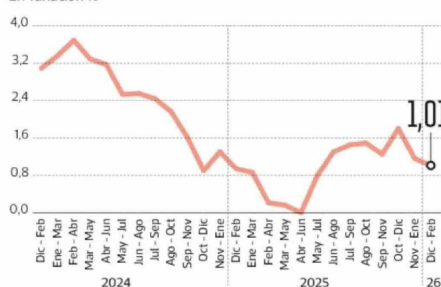
Creación de empleo se desacelera En variación %