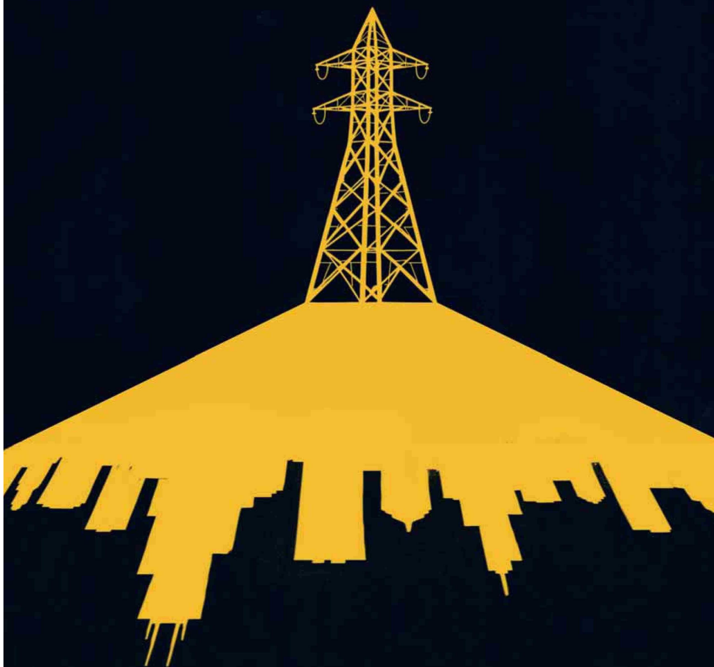
Ilustración: Fabián Rivas