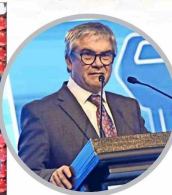
Mario Marcel, ministro de Hacienda, durante el discurso de la segunda jornada de la "Semana de la Construcción 2025".