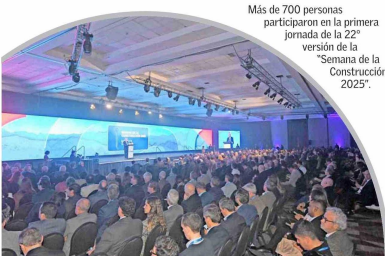
Más de 700 personas participaron en la primera jornada de la 22ª versión de la "Semana de la Construcción 2025".