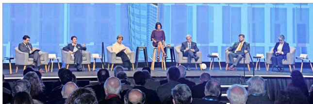
Candidatos presidenciales participaron en un panel de conversación en la jornada inaugural de la Semana de la Construcción.