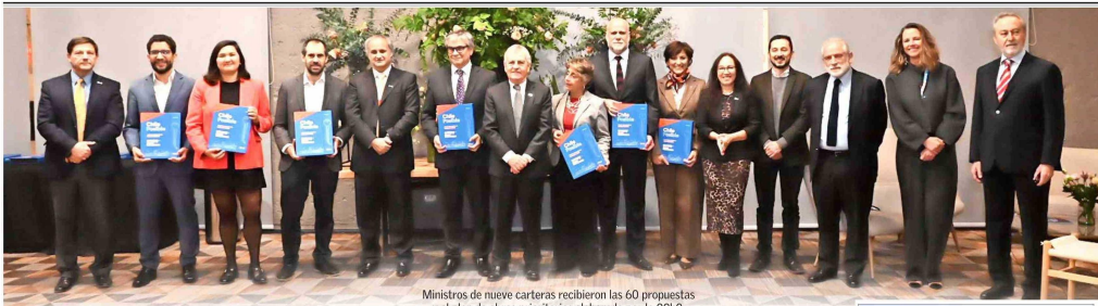
Ministros de nueve carteras recibieron las 60 propuestas y el plan de obras prioritarias elaborado por la CCHC.

Tiraje: 126.654 Lectoría: 320.543 Favorabilidad: No Definida