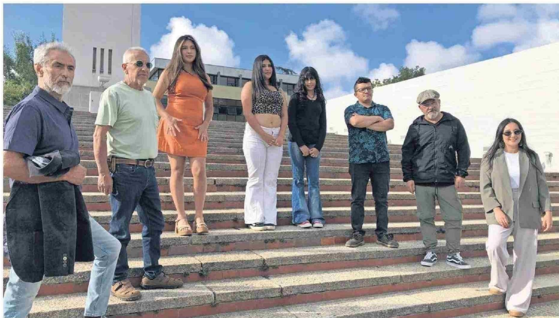
El grupo de autores de los relatos reconocidos en esta nueva versión del certamen se mostraron felices de ser parte del concurso que les sirvió para imaginar la Región.

sé que eran unos amigos haciendo una pitanza.