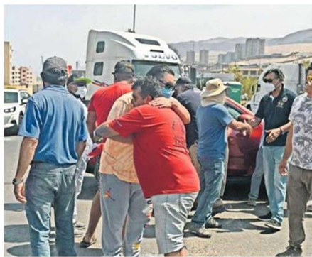
DIRIGENTES ASEGURAN QUE MONITOREARÁN ACUERDO.

Precisó que en el caso de Tarapacá se realizó un movimiento social y por eso no se podía resolver en un corto plazo: “Con este movimiento ganamos, para la gente de Iquique, que el domingo las plazas, parques y playas estuvieran llenas de gente divirtiéndose