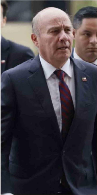
El ministro de Hacienda, Jorge Quiroz.