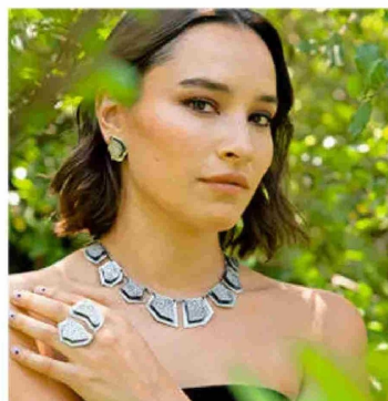
Collar Protección Creador: Panguita Orfebrería $230.390 (Público general $287.990)