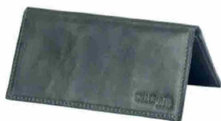
Billetera larga color verde petróleo Creador: Taller Azul $27.190 (Público general $33.990)