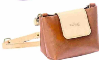
Bandolera de cuero café o verde Creador: Taller Azul $55.990 (Público general $69.990)