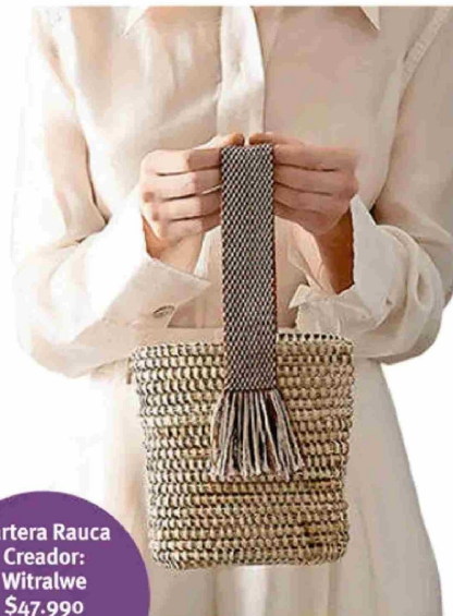
Cartera Rauca Creador: Witalwe $47.990 (Público general $59.990)

Cuándo: hasta el 7 de junio de 2026. Dónde: Av. Nueva Costanera 3900, Casacostanera, Vitacura. Mallplaza Trébol BioBío, Módulo MBL-112 Sector Aires, piso 1. Talcahuano. Arturo Prat 427, Temuco. Sitio web: Primerospueblos.cl *Condiciones en página 34.