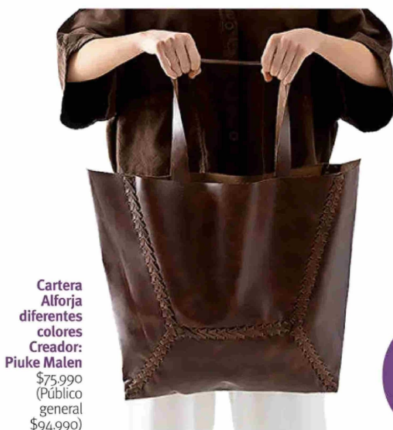
Cartera Alforja diferentes colores Creador: Piuke Malen $75.990 (Público general $94.990)