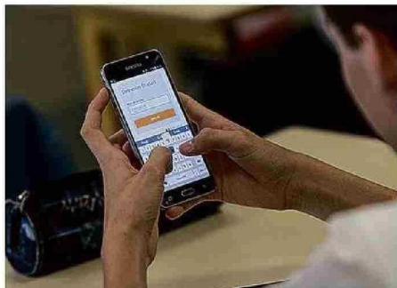
LOS COLEGIOS TENDRÁN QUE ADAPTAR SU REGLAMENTO INTERNO.

pero no impone una prohibición absoluta. “La ley que regula el uso de dispositivos móviles en los establecimientos educacionales establece, como regla general, la restricción de su uso en los niveles de educación parvularia, básica y media, especialmente durante las actividades curriculares”, señaló.