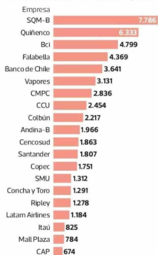
Las 20 empresas que pagan más en el total El desembolso total de cada empresa por remuneraciones de sus directores. En millones de pesos.