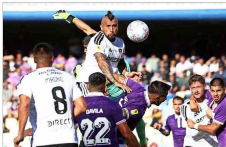
En el plano futbolístico, Colo Colo se pone al día en el Campeonato Nacional: este domingo recibe a Coquimbo.

sancionado infringió el deber de abstención, consistente en la prohibición de adquirir o enajenar, para sí o para terceros, directamente o a través de otras personas, los valores sobre los cuales posea información privilegiada... La resolución de la Comisión sancionada ha de estimarse de extrema gravedad, toda vez que afecta algunos de los bienes jurídicos más preponderantes y celosamente resguardados por la regulación, como son la transparencia y equidad en el mercado de va-