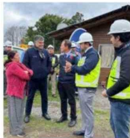
LAS AUTORIDADES ENTREGARON EQUIPO DE RESPALDO EN PLC.