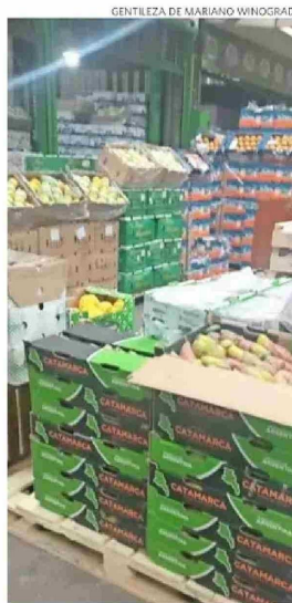
La calidad de la fruta es fundamental en este crecimiento.

El presidente del Comité de paltas, además, afirma que Argentina se está