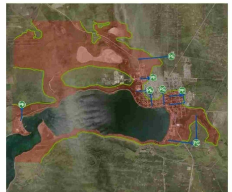
Porvenir cuenta con una zona inundable bastante amplia.

gios y el sector privado es vital para que Magallanes esté realmente preparado ante la fuerza de la naturaleza.