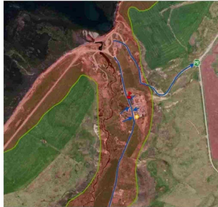
La localidad de Timaukel participará del simulacro, por lo que se dio a conocer cuál es la zona inundable.