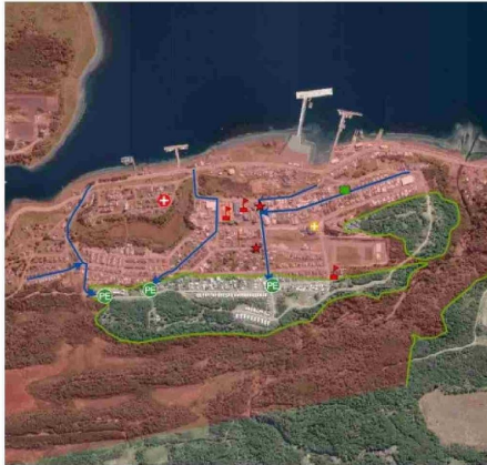
Cabo de Hornos cuenta con una zona inundable prolongada, según el sitio web de Senapred.