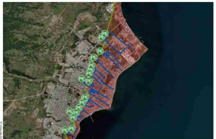
Este es el mapa de evacuación para la capital de la Región de Magallanes, el cual se encuentra disponible en el sitio web de Senapred.

5. Calma: el desplazamiento debe ser rápido pero ordenado, incluyendo a mascotas si es posible.