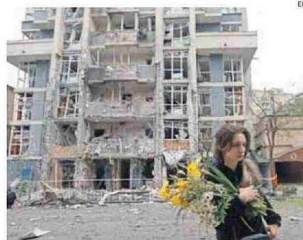
EDIFICIO EN KIEV DAÑADO POR EL ATAQUE RUSO QUE DEJÓ 12 MUERTOS.