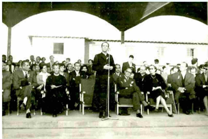
Congregación Hermanos de la Inmaculada Concepción.