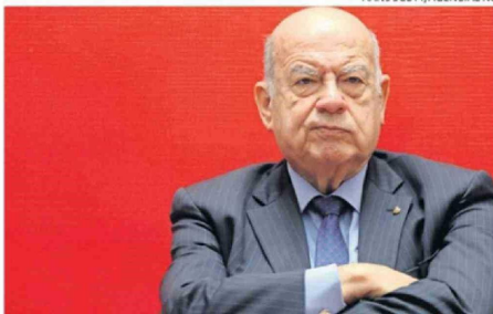
INSULZA VALORÓ QUE LA CMF YA HAYA SANCIONADO POR EL CASO.

En su declaración, Sauer mostró sus reparos al proceso: "Lo más extraño de este bono es que no hubo una colocación de este, sino que lo veo como un arreglo entre gallos y media noche. En la colocación de un bono debe haber oferentes de este, con ofertas de tasas que tales oferentes debían estar dispuestos a pagar ver su tasa real que el mercado válido tal papel. Aquí hubo una fijación de precio