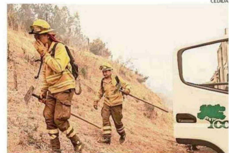
VAN CASI 3 SEMANAS DE COMBATE.