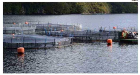
SMA INFORMÓ PREVENTIVAMENTE A CASI MIL ESPACIOS EN EL PAÍS.

Buscan orientar sobre límites de las concesiones acuícolas.