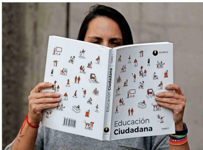
AUTORÍA. — Los 27 colaboradores que participaron en la elaboración de estos libros pertenecen a las más variadas disciplinas, como el Derecho, la Medicina, la Historia, el Periodismo y la Economía.

La Fundación Astoreca presenta la obra de dos tomos centrada en fortalecer la democracia informada desde las aulas. La iniciativa, surgida también de una necesidad docente, ya se aplica en sus colegios y apunta a expandirse al resto del país.