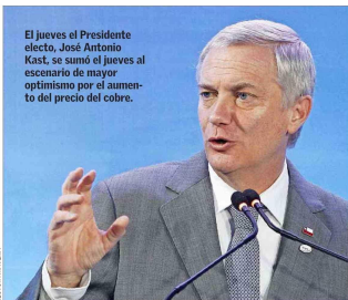
El jueves el Presidente electo, José Antonio Kast, se sumó al jueves al escenario de mayor optimismo por el aumento del precio del cobre.

Expectativas de crecimiento tendrían sesgo al alza y habría menor presión sobre el ajuste fiscal de los US$ 6.000 millones. Analistas advierten riesgos por el lado externo y por el rol que tendrá la futura oposición.