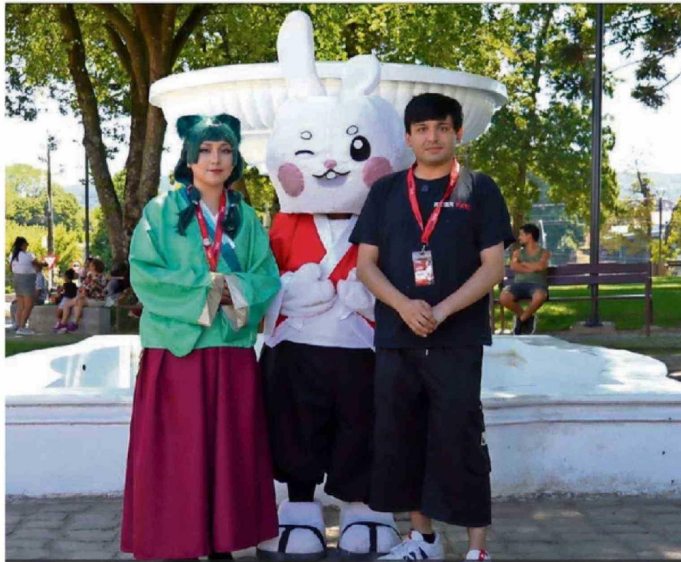
EL FESTIVAL AKIBA FEST ESTÁ NOMINADO COMO EVENTO EN LA CATEGORÍA DE CULTURA, ARTE Y PATRIMONIO.

son entregados de manera directa por los organizadores del Valdivia Destaca. Corresponde a las categorías "Dirigente destacado", "Huella valdiviana" y "Valdivia siempre".