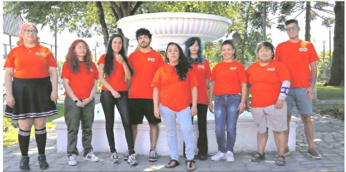
LA CORPORACIÓN ANTILÉN ES UNA DE LAS TRES INSTITUCIONES NOMINADAS EN LA CATEGORÍA INICIATIVA TERRITORIAL.