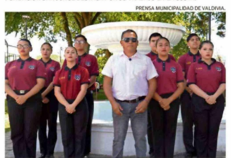
BANDA DE GUERRA DEL LICEO ARMANDO ROBLES RIVERA.

En Salud el reconocimiento se entrega a aquellas personas u organizaciones destacadas por su vocación, gestión y compromiso con la educación pública. Los nominados son: