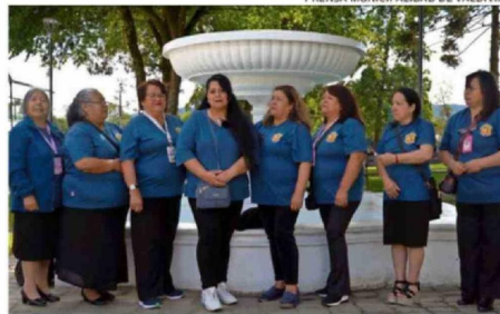
AGRUPACIÓN SOCIAL UN DÍA A LA VEZ.

lla: Una iniciativa comunitaria en pro de la defensa y protección del Humedal Angachilla.