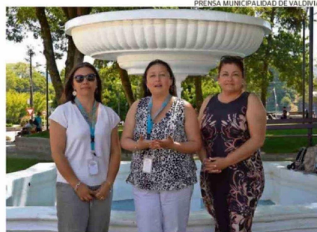
ONCOSUR ENTREGA ACOMPAÑAMIENTO A PERSONAS CON CÁNCER.

nización referente en inclusión social y accesibilidad, reconocida internacionalmente por su innovador modelo aplicado a eventos públicos.