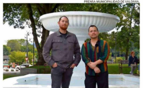
FUNDACIÓN SAN JORGE DESTACA POR SU TRABAJO EN LA COSTA.