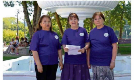
LA AGRUPACIÓN REDES QUE SANAN.

Fundación Creciendo Activos: Institución que promueve la formación integral de niños, niñas y adolescentes en contextos de vulnerabilidad, utilizando el deporte como herramienta.