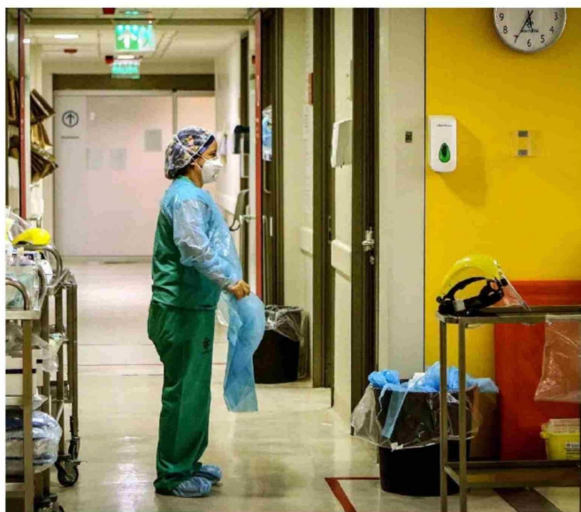
En los hospitales públicos, el número de camas de maternidad disponibles ha bajado casi un 23% en la última década.

Es que basta con ver los números que reporta el Instituto Nacional de Estadísticas (INE) para entender lo que hay detrás: las cifras provisionales de 2024 arrojaron que el año pasado hubo 154.441 nacimientos