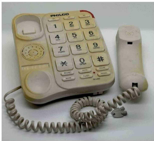
► El Archivo resguarda objetos personales, como este teléfono.