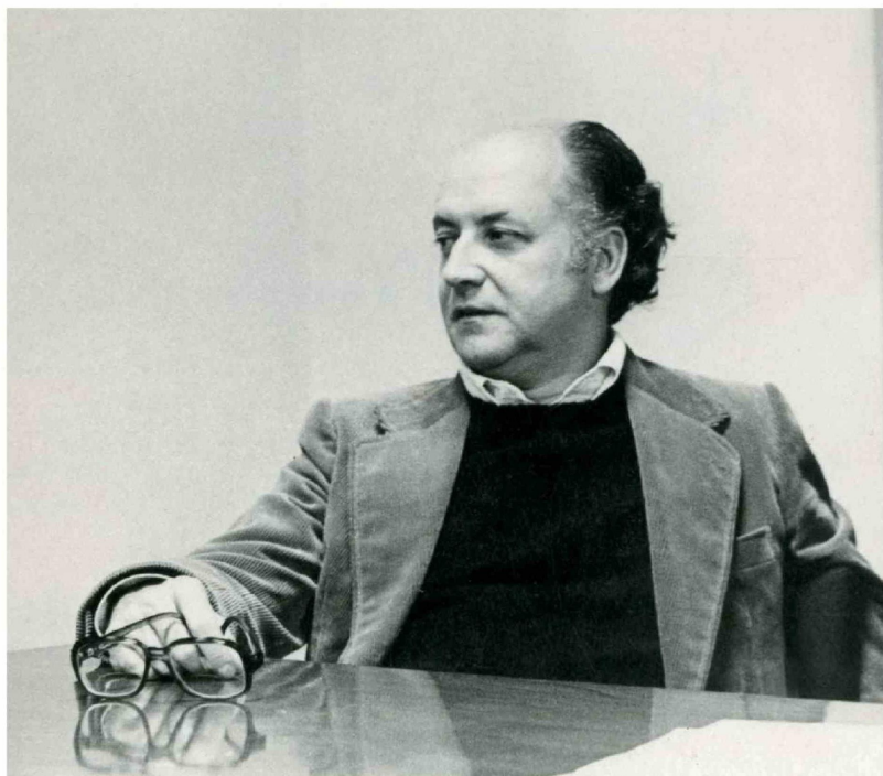
► Jorge Edwards obtuvo el Premio Nacional de Literatura y el Premio Cervantes.