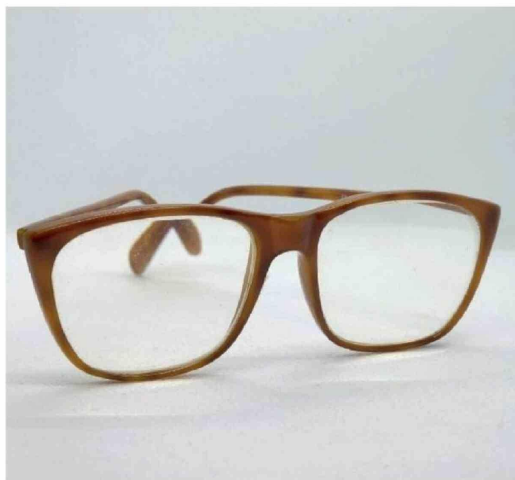
► Sus anteojos también son parte de su patrimonio personal.

tos de trabajo y desde las huellas materiales de su proceso de escritura", apunta Martínez.