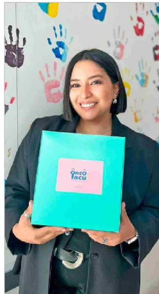
Un momento significativo para la marca fue poder realizar una donación de vestuario para la Clínica Dávila, en la Región Metropolitana.