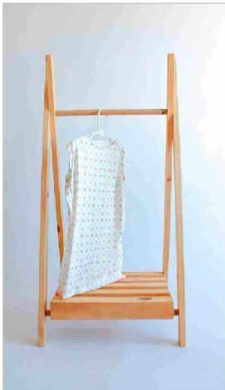
Con batas de la mejor calidad, los detalles son ideados pensando en exámenes, controles médicos, sondas y catéteres.