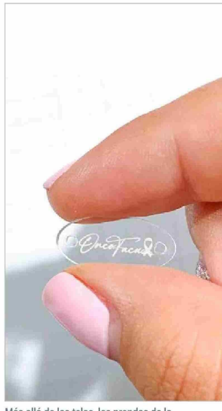
Más allá de las telas, las prendas de la marca contemplan detalles como botones plásticos y placas de acrílico que no interfieran con procesos de imagenología.