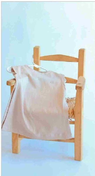
Además de batas, OncoFacu tiene en su catálogo poleras y pecheras con las mismas consideraciones médicas.