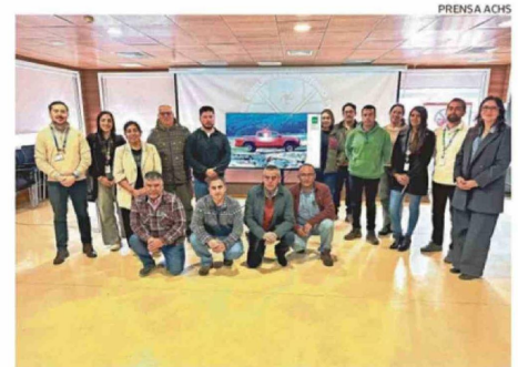
CONDUCTORES DEL SAMU ASISTIERON A LOS CURSOS DE CAPACITACIÓN.