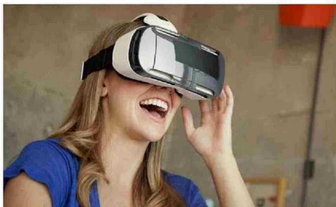
A TRAVÉS DE LENTES DE REALIDAD VIRTUAL SE PODRÁ INGRESAR A UN MODELO 3D DE LAS OBRAS DE ARTE.