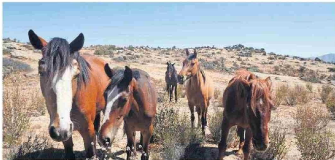
LOS CABALLOS SE ROBARON LA PELÍCULA EN ESTE INICIO DE LOS TALLERES DE FOTOGRAFÍA.