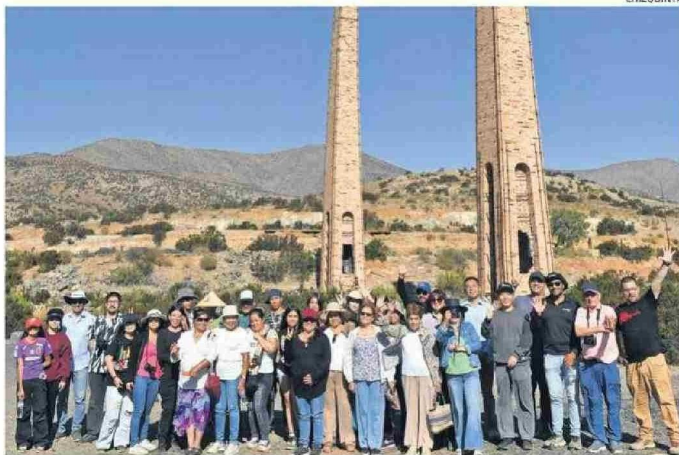
TODOS LOS PARTICIPANTES DEL TALLER DE FOTOGRAFÍA EN UNO DE LOS RECORRIDOS.

INSTANCIA. Freirina fue el punto de partida del ciclo de Talleres de Fotografía Patrimonial, iniciativa orientada a poner en valor el patrimonio histórico, cultural, escénico y natural de las regiones de Atacama y Coquimbo, a través de la formación y participación activa de la comunidad. El taller forma parte de los programas formativos sobre el valor patrimonial y herencia territorial, impulsados bajo el Compromiso Ambiental Voluntario de la Resolución de Calificación Ambiental (RCA) de la Línea de Transmisión de Eletrans, parte del Grupo Empresas Chilquinta. Se puso en práctica lo aprendido con recorridos por el Edificio Los Portales, y la Iglesia Santa Rosa de Lima, además de salidas a terreno, en particular, al pueblo minero de Canutillo y Chimeneas de Labrar.