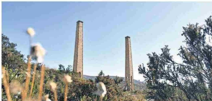
VARIAS TOMAS Y ESCENAS MARCARON LA PAUTA DE LOS FOTÓGRAFOS.