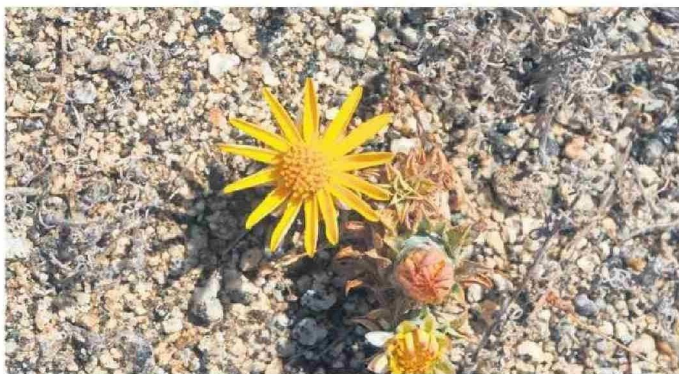
LOS PARTICIPANTES QUEDARON MARAVILLADOS POR LOS COLORES Y FORMAS DE LA FLORA EN LA REGIÓN.