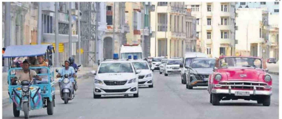
ESTADOS UNIDOS AFIRMA QUE EL RÉGIMEN CUBANO "TIENE LOS DÍAS CONTADOS" POR LA ESCASEZ DE COMBUSTIBLE A CAUSA DEL BLOQUEO.