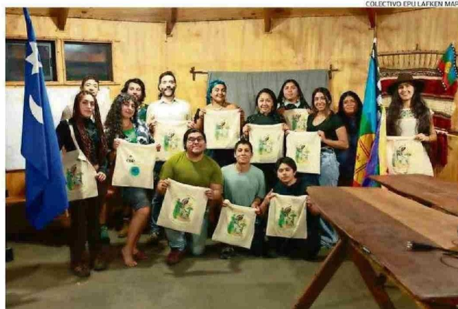
LA JORNADA FUE PARTE DEL V TRANSECTO INTERCULTURAL POR LOS RÍOS Y AGUAS LIBRES.

La jornada incluyó además el "V Transecto Intercultural por los Ríos y Aguas Libres", impulsado por el Colectivo Epu Lafken Mapu, una experiencia de monitoreo, navegación y observación que recorre el sistema hídrico desde su nacimiento en el lago Mülhue hasta su desembocadura en el lago Ranco.