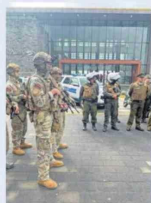
Propuestas para el estado de excepción Alcaldes y senadores analizan las nuevas medidas anunciadas para la Macrozona Sur. PÁG. 4