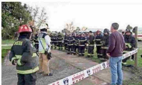
QUILLÓN HA SIDO PIONERO EN LA CREACIÓN DE UNIDADES ESPECIALIZADAS.

Entre los ejercicios realizados destacan simuladores de entrada forzada, manio-