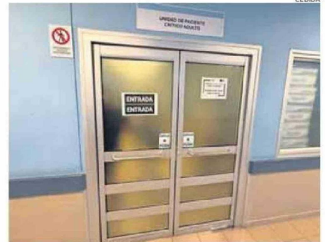
LOS CUIDADOS DE LA PEDIATRA ESTÁN BAJO ESTRUCTOS PROTOCOLOS.