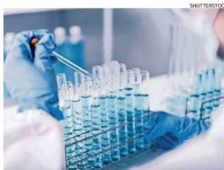
La vacuna espera superar los tratamientos convencionales.

“Las vacunas terapéuticas han abierto un nuevo horizonte de esperanza en la lucha contra el cáncer.”