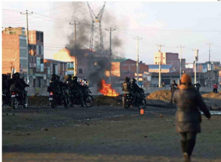
EL APAGÓN AFECTÓ A 5 MUNICIPIOS DE LA ZONA CENTRO DE BOLIVIA, CAUSANDO LA REACCIÓN DE MANIFESTANTES.

El exmandatario permanece en el Trópico de Cochabamba, una de las principales zonas