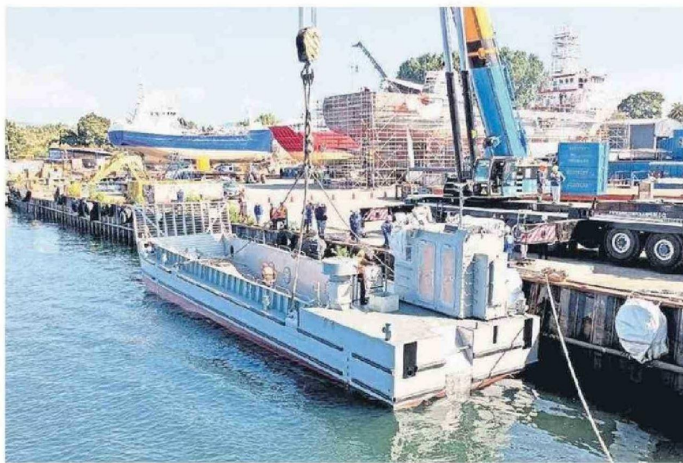
Lanzamiento al agua de la primera barcaza del Proyecto Escotillón IV

Actualmente, la empresa estatal impulsa uno de sus proyectos más relevantes de las últimas décadas: el Proyecto Escotillón IV, iniciativa que se enmarca en el proceso de renovación de la flota de la Armada de Chile y el aumento de su capacidad logística y operativa. El programa considera la construcción de cuatro buques multipropósito, destinados a apoyar operaciones de transporte de carga, vehículos pesados y equipamiento, además de su empleo en misiones