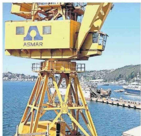
Astillero en la ciudad de Talcahuano.