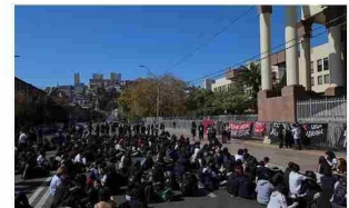
Participaron en la movilización, estudiantes de liceos emblemáticos y de la Pontificia Universidad Católica de Valparaíso (PUCV), la Universidad de Valparaíso (UV) y la Universidad de Playa Ancha (UPLA).