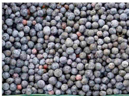
ARÁNDANOS OCUPAN EL CUARTO LUGAR ENTRE FRUTAS DE EXPORTACIÓN.