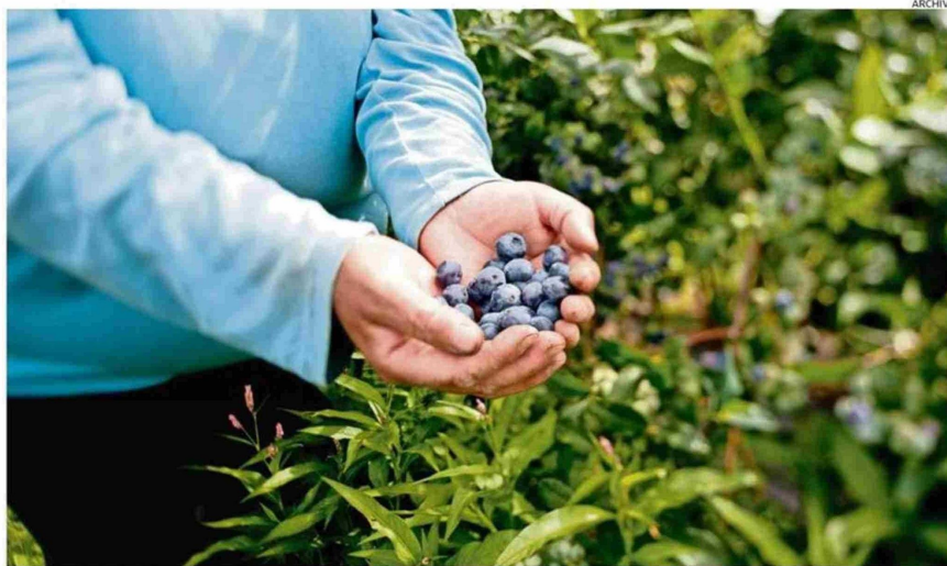
PRODUCTORES LOCALES DE ARÁNDANOS LEVANTARON MESA DE TRABAJO CON LAS AUTORIDADES PARA VER POSIBLES SOLUCIONES.

puesto ocupan los arándanos entre las frutas chilenas más exportadas. La primera es la cereza.